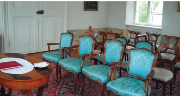
Gräfin Arco Zimmer in der Seeburg für standesamtliche Trauungen

Sie können sich hier sowohl standesamtlich als auch kirchlich trauen lassen. Das im Biedermeierstil eingerichtete und mit wunderschönen Wandmalereien verzierte Gräfin Arco Zimmer ist eines der bezauberndsten Standesämter im Land Salzburg.