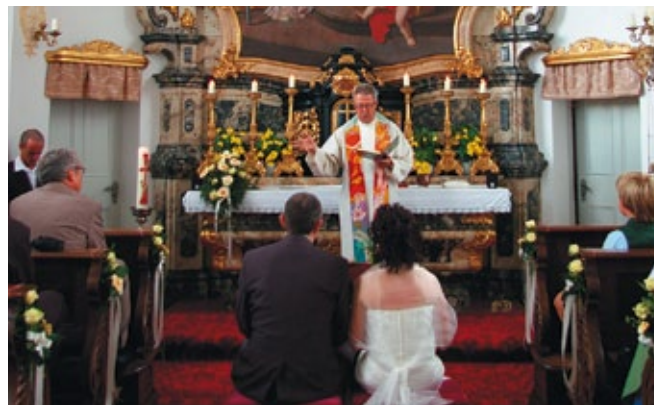
Schlosskapelle in der Seeburg

Sie können sich hier sowohl standesamtlich als auch kirchlich trauen lassen. Das im Biedermeierstil eingerichtete und mit wunderschönen Wandmalereien verzierte Gräfin Arco Zimmer ist eines der bezauberndsten Standesämter im Land Salzburg.